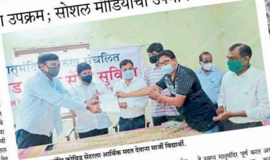
देवरुख : मातृमंदिर कोविड सेंटरला आर्थिक मदत देताना माजी विद्यार्थ्यांचा उपक्रम.

साडवली, ता. २८ : प्रत्येक शहराची ओळख असणारी काही ठिकाणे असतात. देवरुख येथील मातृमंदिर ही अशीच संस्था असून स्वातंत्र्यपूर्व काळापासून त्या शाळेचे अभिमानाने नाव घेतले जाते, त्या न्यू इन्स्टीट्यूटच्या १९८४ दहली बंधनधोल माजी विद्यार्थ्यांनी सोशल मीडियाचा वापर करत मातृमंदिर कोविड सेंटरला हजारांच्या वस्तूंचा धन आभार देऊन उपस्थितीमध्ये हेगशेटो देण्यात पुणे पुढे