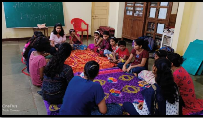
रविवार वाचनकट्टा – गोकुळ