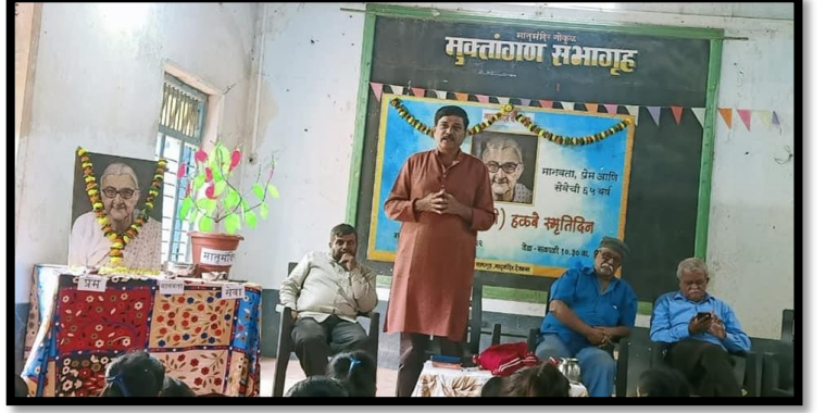
हळबे मावशी स्मृतिदिन