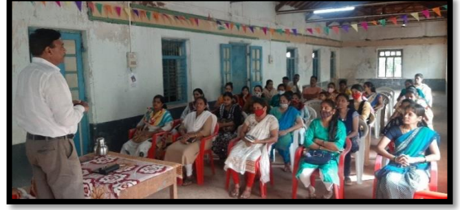
मातृमंदिर पालक संवाद