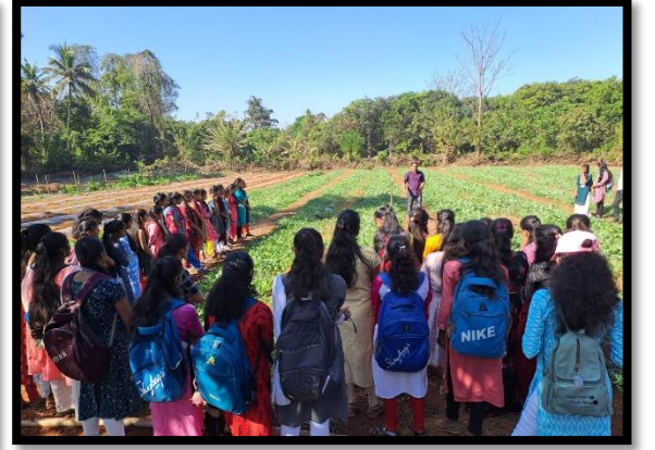
फार्मवरील एकदिवसीय सहल