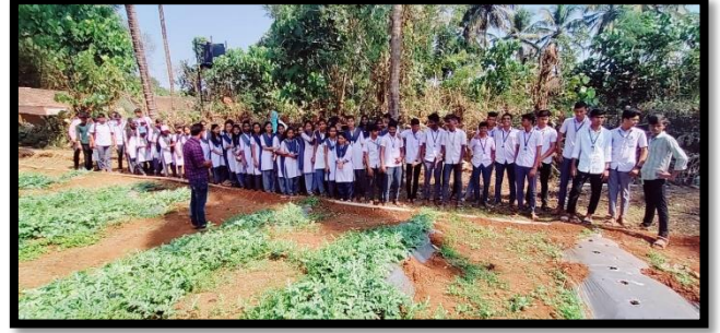
फार्मवरील एकदिवसीय सहल