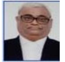
सुहास बने कार्यवाह