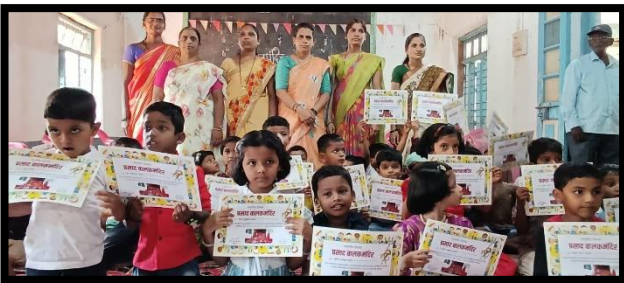
निरोप समारंभ - प्रसाद बालक मंदिर