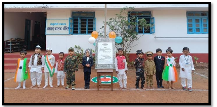
प्रजासत्ताक दिन- प्रसाद बालक मंदिर