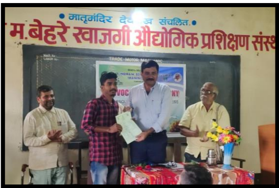
ITI – पदवीदान समारंभ