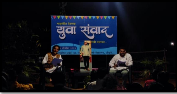
नाथ पै अभिवचन कार्यक्रम